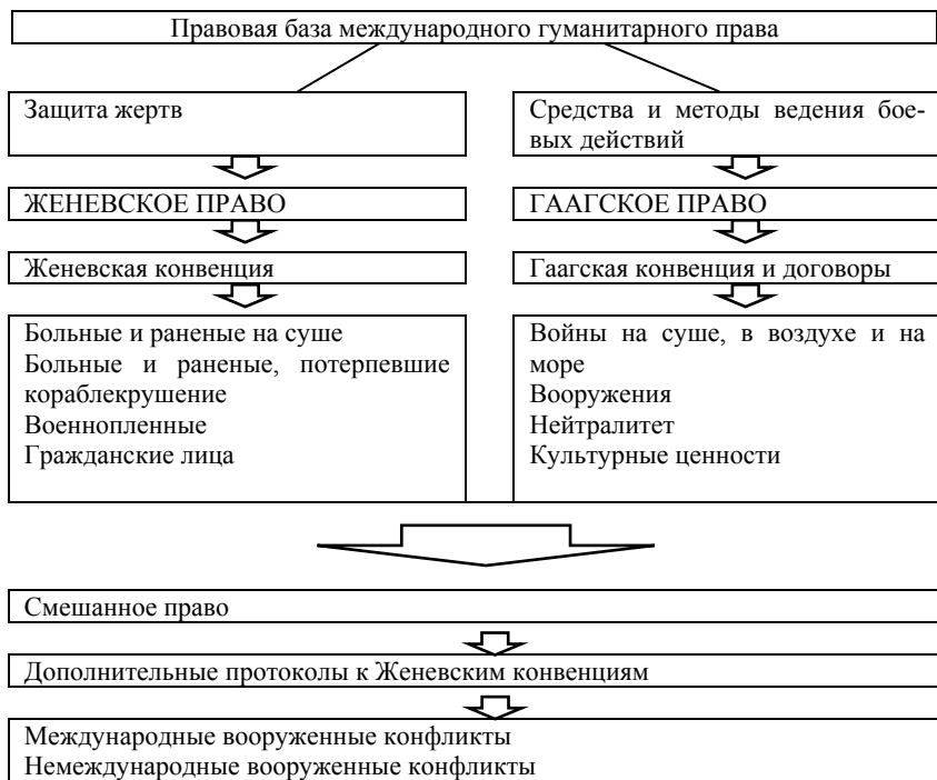
Рис. 6. Нормативно-правовая база МГП

а также конкретные средства, которые запрещено использовать в военном противостоянии (рис. 6). Так, например, под запретом применение многих видов оружия, в частности зажигательных пуль, ядерного, химического, биологического, лазерного оружия.