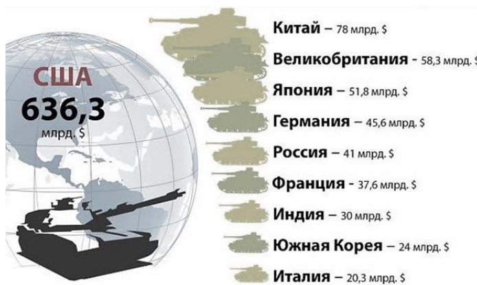
Рис.4. Военные расходы крупнейших стран мира

Военные расходы НАТО составляют примерно 70%. Россия по военным расходам на душу населения занимает далеко не ведущее место, но вынуждена планировать финансирование на перевооружение армии и флота с целью противостоять внешней военной угрозе (рис. 4).