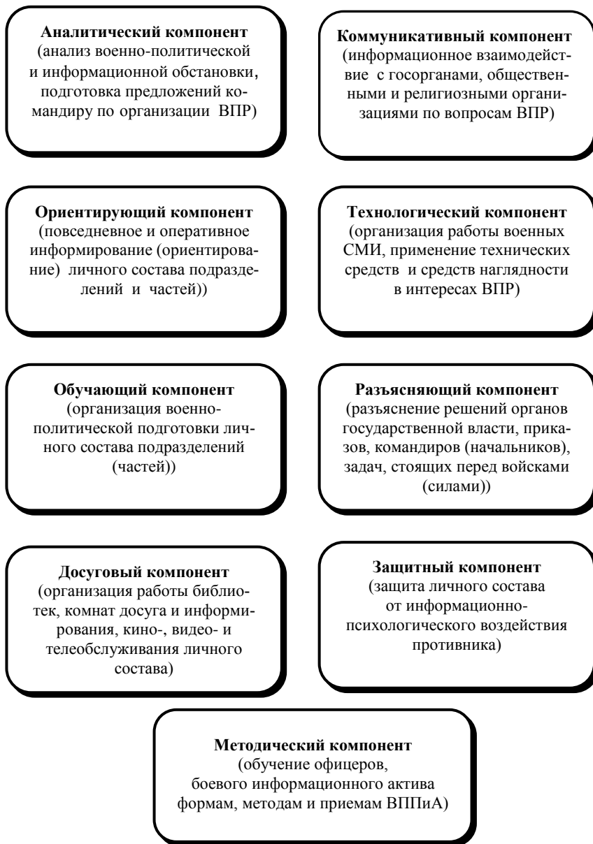
Рис. 1. Содержание военно-политической пропаганды и агитации в части (подразделении)