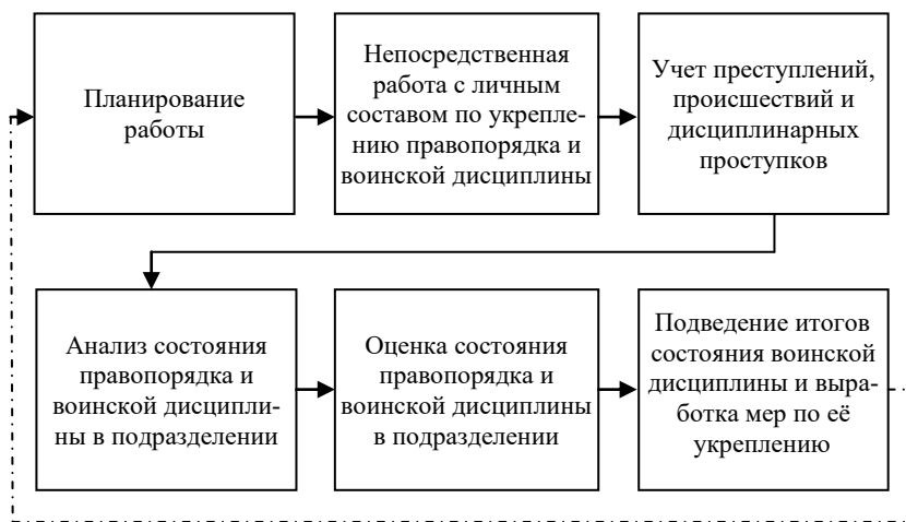
Рис. 1. Организаторская работа командира подразделения по укреплению правопорядка и воинской дисциплины

Планирование работы по укреплению правопорядка и воинской дисциплины в роте (ей равной) осуществляется с учётом мероприятий комплексного плана полка (корабля 1-го ранга) и реального текущего состояния правопорядка и воинской дисциплины в подразделении.