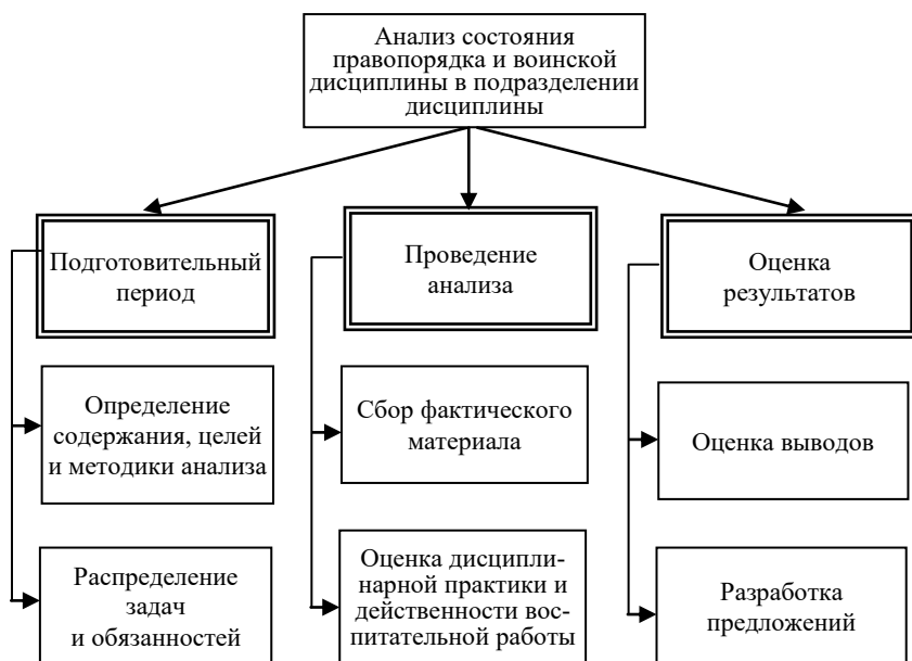
Рис. 3. Анализ состояния правопорядка и воинской дисциплины в подразделении

Анализ состояния правопорядка и воинской дисциплины проводится в определённой последовательности и включает в себя ряд этапов (рис. 3).